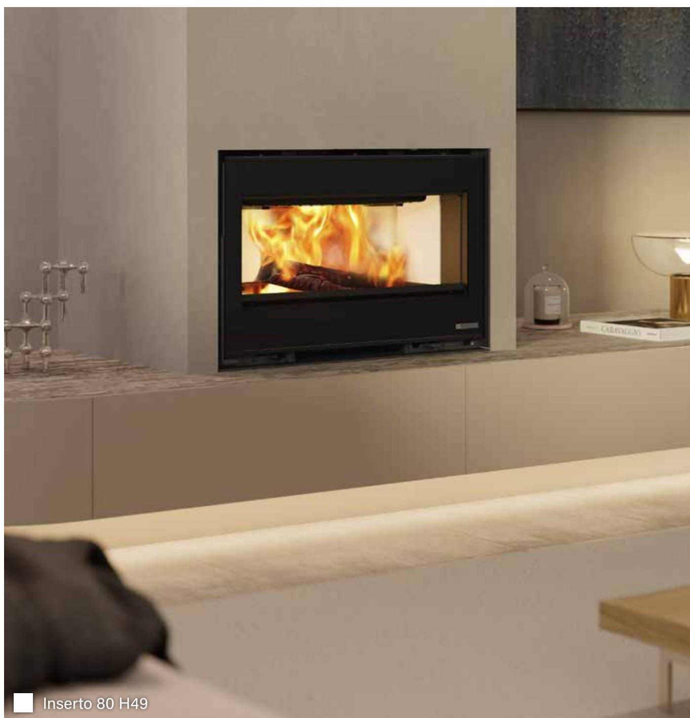
Inserto 80 H49