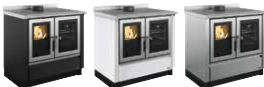
Noir Antracite *

Cuisinière à bois encastrable ou free standing